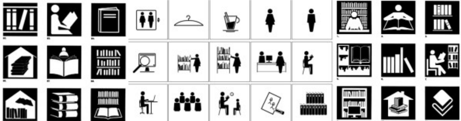
Uso de pictogramas en la señalización de bibliotecas